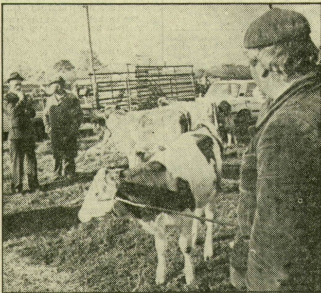
A tehenek sem ballagtak gyalog

Egy három hónapos kiskibát többen nézegettek. Tizenháromezerért kérték érte, a zánkányzéki vevőjelölt ezeröttszázal kevesebbet ígért. Nem véletlen, mivel a jó vásárlásról ez a véleménye: szepet kispénzért, s