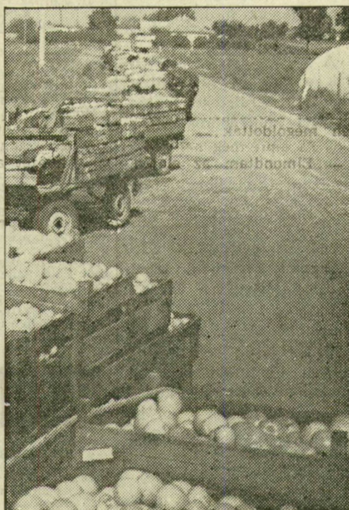
Képeinken: paradicsommal megrakott konténerek Bordányban, és a domaszékiek „türelmes” lovasköcsi sora.

A tegnapi eső jól jött a növényeknek, igaz, az augusztus végi csapadék még nem tűnt el egészen a talajból. A Felszabadulás Tiszben jobb kukoricatermesre számíthatnak emiatt. A paprika hajtásai zsengebbek, a közepes terméshez még egy meleg, hosszú ősz elkélne. Forráskúton megkezdtek a korai csemegeszőlő szedését, s az őszi burgonya ársását is tovább folytatják, ha az eső engedi.