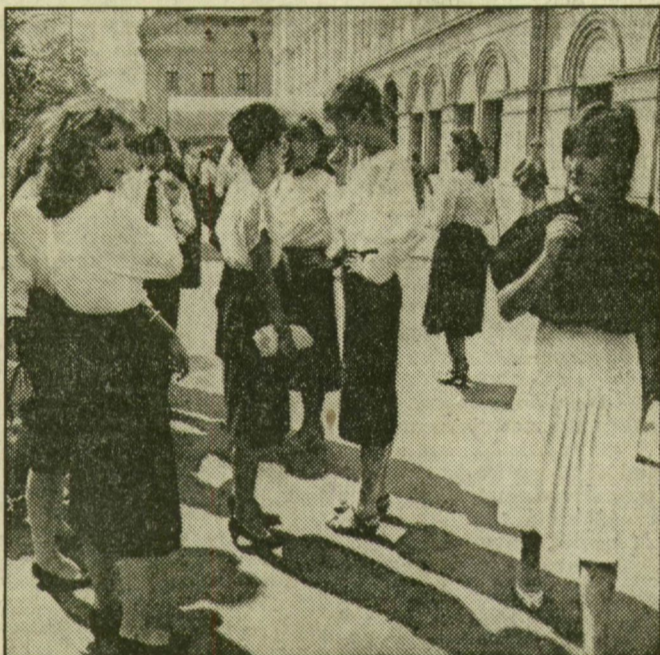
A tanévnyitóra gyülekeznek a főiskola új hallgatói