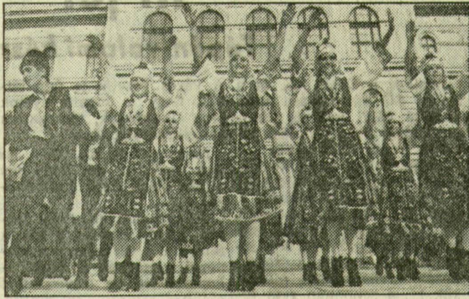
Szép lányok, szép ruhákban — a közönségdíjas bolgár együttesből

Lezárult a tizedik nemzetközi néptáncfesztivál folklórbemutatóinak sora. A három újszegedi estén Vastagh Attila reflektorfényekhez tervezett, elegánsan pasztell díszletében tíz ország táncosai és zenészei „tették élénk” népük kultúrájának válogatott gyöngyszemeit. Pénteken, szombaton és vasárnap egyaránt akadt „csemege” a látványos-vidámságra és közönségnek, még a szíveorúbb szemmel figyelő szakmabelieknek is.