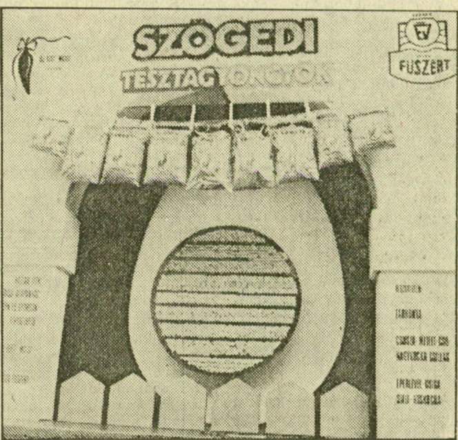
„Tésztaáruháza” az Oskola utcai üzlet fődíjas kirakatában

Négy megye, 11 vállalat illetve szövetkezet, 21 versenyző, 17 kirakat — ezek az idei verseny „személyi adatai”. A zsűri megállapítása szerint az érdeklődés az elvált alatt maradt, a versenyablakok színvonalja jó közepes volt — az átlagtol lényegesen jobb és rosszabb verseny munka nem készült. Ötletekben, vevőcsalogató szlogenekben azért nem volt hiány, bár ezek egy részének indokoltságát, egyértelműségét lehetne vitatni.