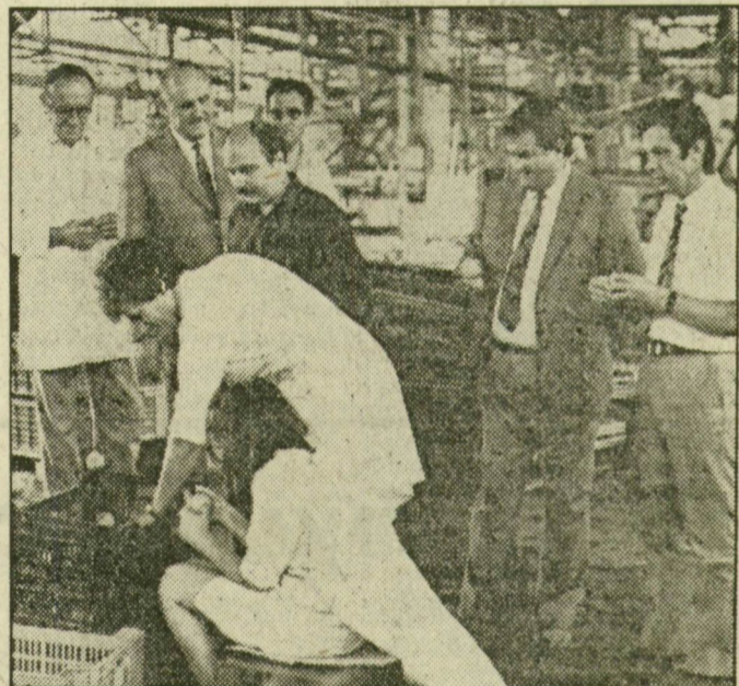
A városi és megyei vezetők látogatóban a konzervgyári építőtáborosoknál

Ezek szerint minden rendben? Sajnos, nem. Az üveg-inar nem tudja elegendő csomagolóeszközzel ellátni a gyárat, napról napra érkeznek külföldről a dobozok, hogy végül mégse vesznek kárba ez a bizonyos rekordtermés. A gépek átállítása, a változó csomagoló-megoldások persze több munkáskezet is igényelnek. Tehát ez is bizonyíték arra,