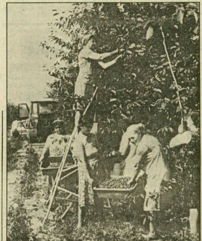
Hagyományos kézi szedés