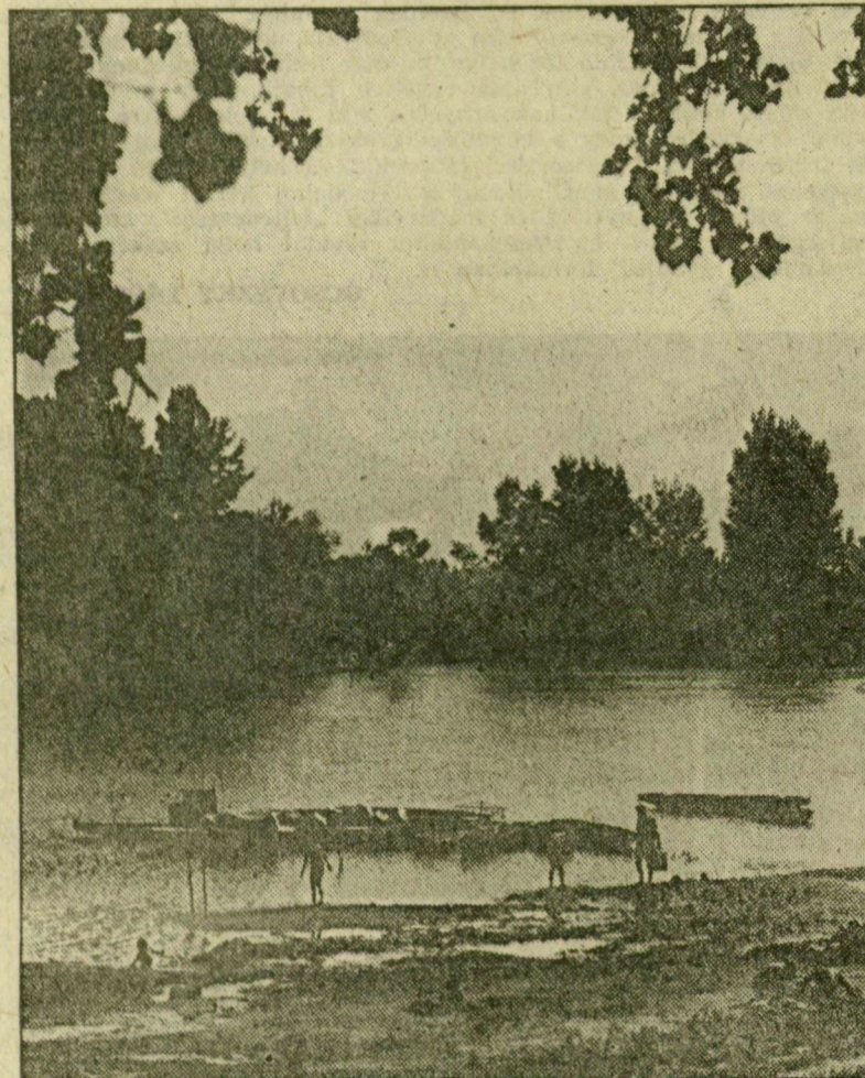
Víz, napfény, csónakok, pihenő emberek a Körös-toroknál