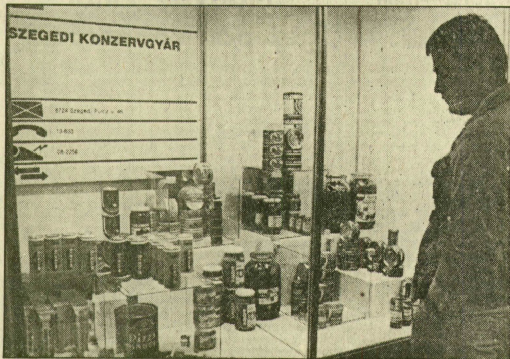
A szegedi konzervek bemutatójának egy részlete

Sajtótájékoztató — Megkezdődtek a szakmai napok Tizenegy ágazat bemutatkozása