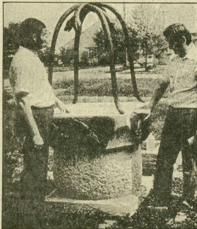
Megérkezett a díszkút felső része