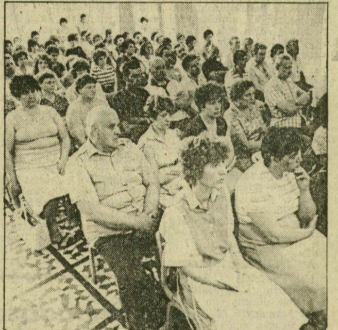
A 4. országgyűlési választási kerület gyűlése: résztvevők