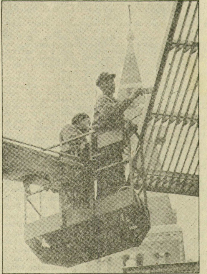
Igy szépült meg a napellenző