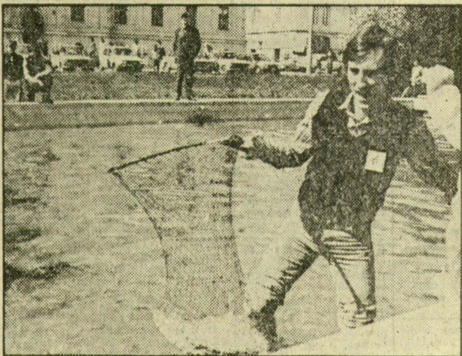
Hallgatók — a Széchenyi téri diszmedencében

Midőn pedig este 8 óra előtt a fenti központba érkezett csapatok kíséretében az adott vállalatok vonzó tűzoltóöltözékben pompázó párttitkárai beadták a jelentést a zsűrielnök Tóth Tamás nak — ki civilben a városi KISZ-bizottság első titkára ugyan, de hasonló szerelésben (bár a kellenél néhány számmal kisebb tányérsapkában) feszített — már a végső csúcspont előtt állunk. A szakszervezeti funkcionáriusok tüzet oltottak (ez a dolguk, nem?), a behozott cicapéldányok pon-