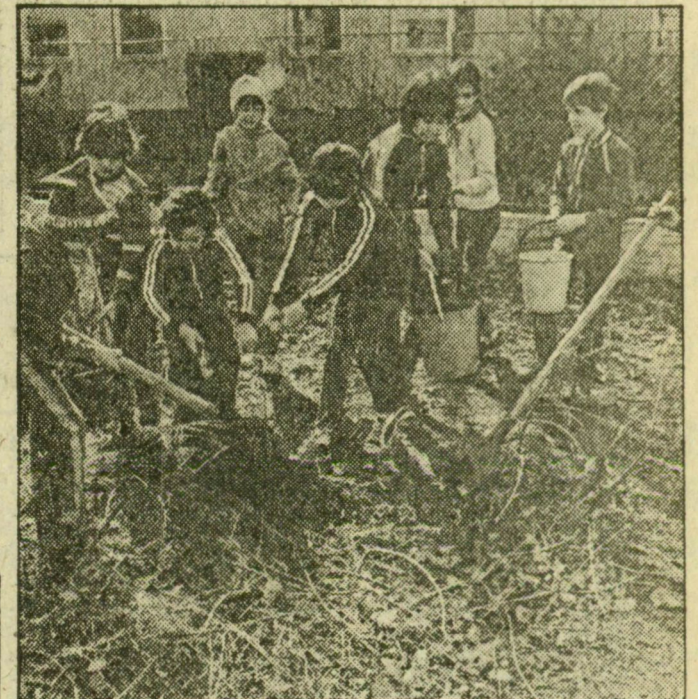
A tarjáni piros iskolánál

A diákok munkájára kétször is szükség lesz! A Honvéd téren népfrosztásokat kerestem, de csak a (Folytatás a 2. oldalon.)