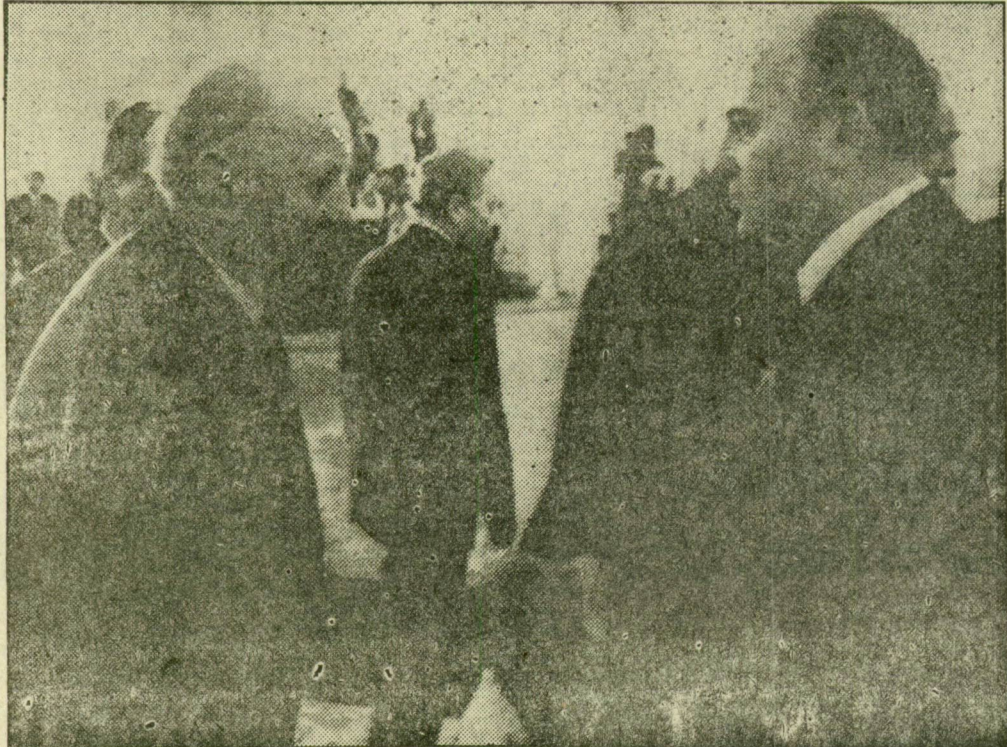
Kádár János együttérzését fejezi ki Mihail Gorbacsovnak Konsztantyin Csernyenko halála miatt.

Rendkívüli ülést tartott tegnap a népfrejt városi elnöksége, ahol megtárgyalták a városi bizottság ideai országgyűlési képviselő és tanácsstagi választások politikai, szervezeti előkészítésére, megrendezésére vonatkozó feladattervét, valamint az előkészítés egyes szakaszait és ütemtervét.