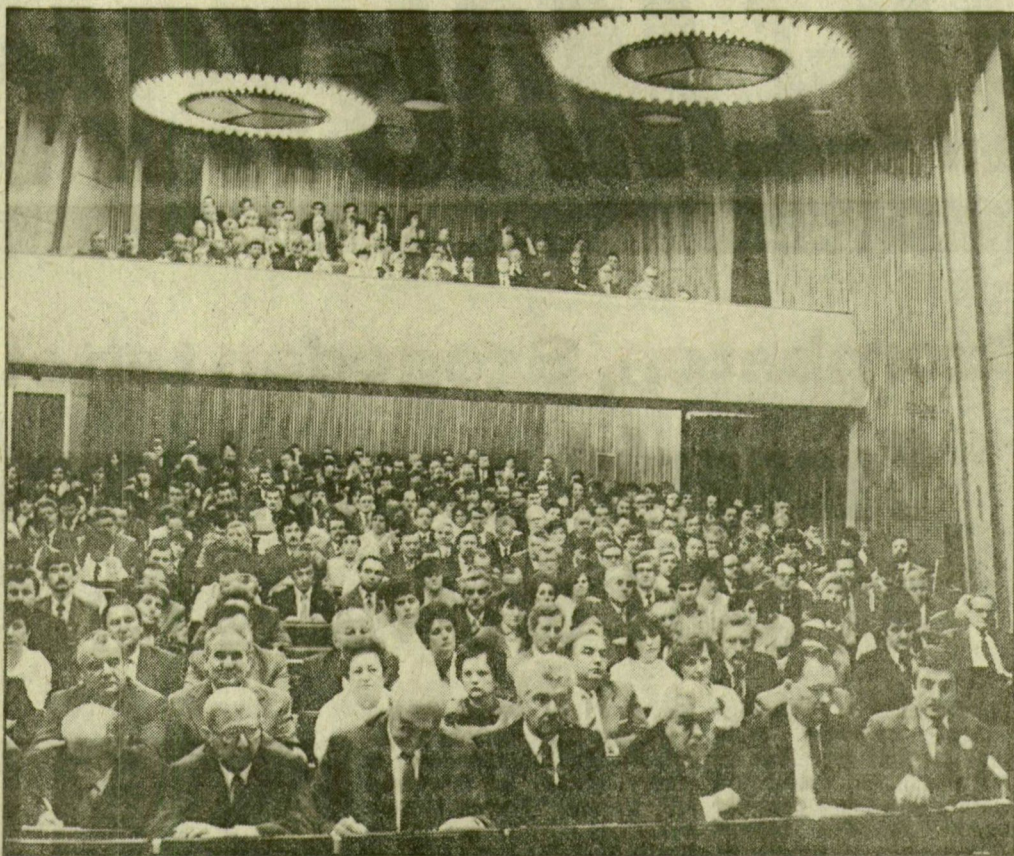
Pillanatkép a párttervezletről

Öt évről, bármilyen körültekintő munkát végeztünk is megyei pártbizottságunk, bizonyára nem tudunk minden részletre kiterjedő értékelést adni. Úgy gondolom, hogy Csongrád megye kommunistáinak legfőbb testülete — a megyei párttervezlet — az írásos beszámoló és annak szóbeli kiegészítése alapján mégis megfelelő képet alkothat az elmúlt öt esztendőben végzett munkáról. Bizonyosra veszem, hogy e munkaértékelést jelentősen gazdagítani fogják a főlészólások, az itt sorra kerülő vita. Kérem a tisztelt párttervezletet, hogy vitassa meg és emelje határozattá pártbizottságunk előterjesztéseit.