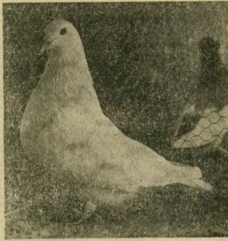
Egymásra nézve — szemtől szembe, galambom