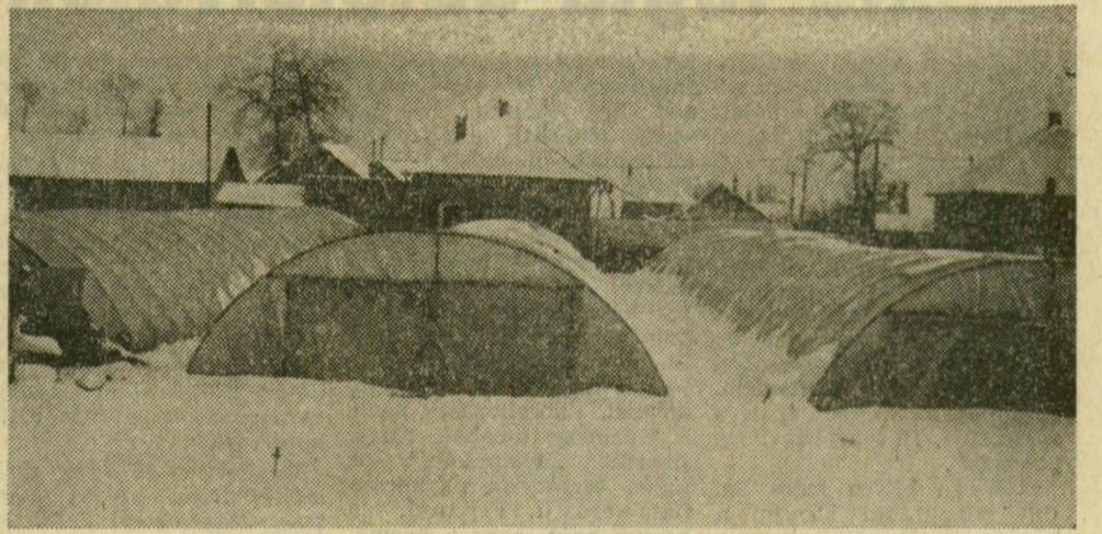
Ha „kifakarkják” a fóliásátrak alól, megfagy a retek.