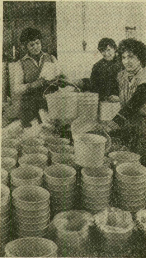
Vödörket „emelgetnek” az asszonyok

Tisztelettel kérem az alkotóellenes bizottságok, bármilyen testületek és antialkoholista szimpatizánsok megbocsátását: a címet nem a szesztestvéri sanda szolidaritás adta tollamra, hogy némiképp becsempésszem a „piaprobandát”. Sőt! Szeretném kijelenteni, ha minden borbarát az alábbiakban bemutatott fröccsre térne át, a detoxikálót át lehetne alakítani gombaháznak. Az legálább hasznát hoz.