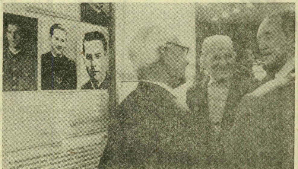
Somogyi Károlyné felvételei