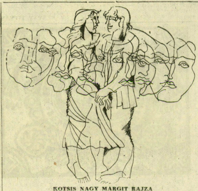
KOTSIS NAGY MARGIT RAJZA