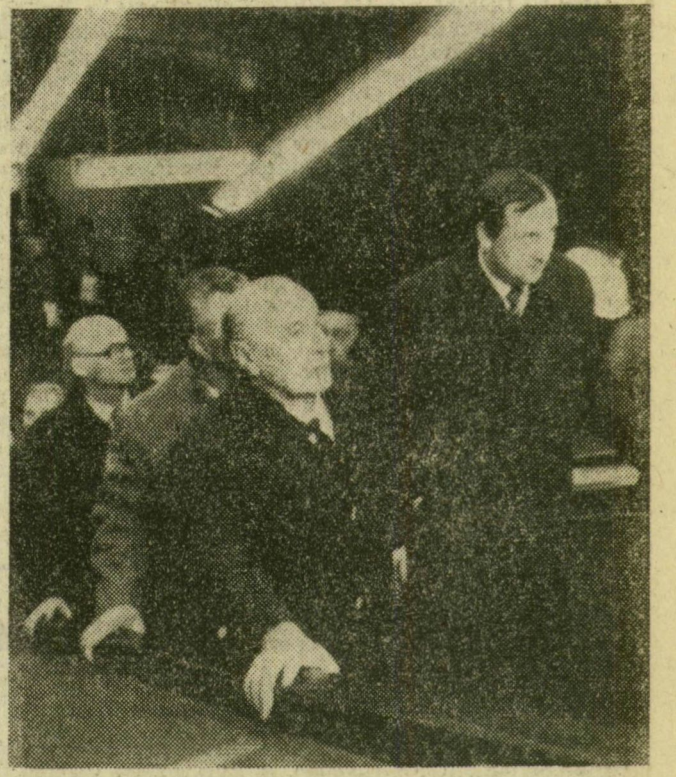
Kádár János és kísérete a metró új mozgólépcsőjén.

Kádár János, Lázár György és a kormány tagjai a tájékoztatót követően vendéglátóik kíséretében megtekintették a felújított Óbudai Fő teret, betértek az új Sípó halászkertbe. A séta a Hídó utcán, a Radeberger sörözőt megkerülve, feljött a Kórház utcán át a Flórián tér felé: a járdákon sok száz erre közlekedő, az ablakból az itt élő emberek köszöntötték kedves mosolyokkal, integetéssel a párt és a kormány vezetőit. A program a Flórián téri gyalogos aluljáróban folytatódott. Ez a létesítmény inkább aluljárórendszernek nevezhető: számtalan folyosója, nyitott, fedett terei hatalmas, ám könnyen kiismerhető közlekedési csomóponttá teszik, amely nem utolsósorban azért lett ilyen nagy — több mint 14 ezer négyzetméteres —, hogy helyet adhasson a római kori műemlékek bemutatójának is, Aquincumnak. Az építők