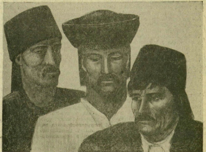
KURUCZ D. ISTVÁN: TANULMÁNYFEJEK 48-AS PANNÓHOZ