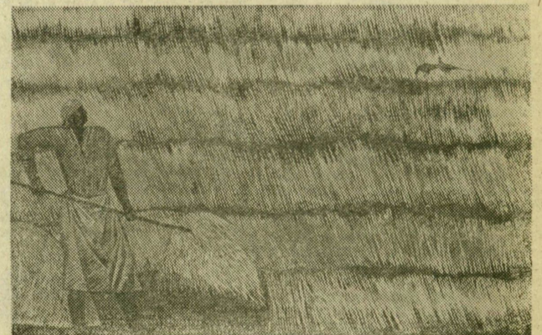
HÉZSÓ FERENC: SZÉNAGYŰJTŐK