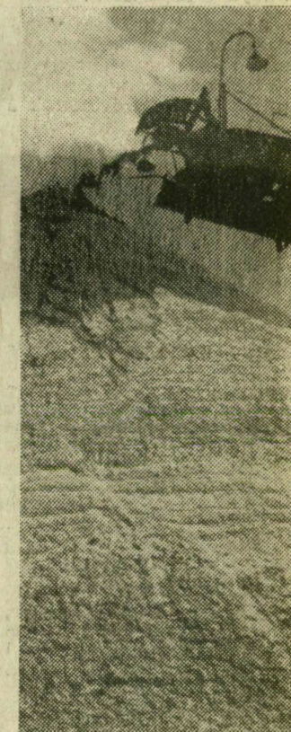
NAGYBAN... Hazánkban nincs eszkimó, FOKÁ-ból is csak egy van. A vállalat — FOKA — dolgozói kavicsot és homokot termelnek ki a folyóból. Hajdani sziklákat tulajdonképpen, és türelmes emberek, mert kivárik az időt, amíg a szikla porrá válik, azaz homokká, hogy aztán segítségével épületet lehessen emelni. Szegeden napi 1200 köbmétert vesznek ki a kotrógépek a folyóból. Munkájukat mutatja be Nagy László képriportja