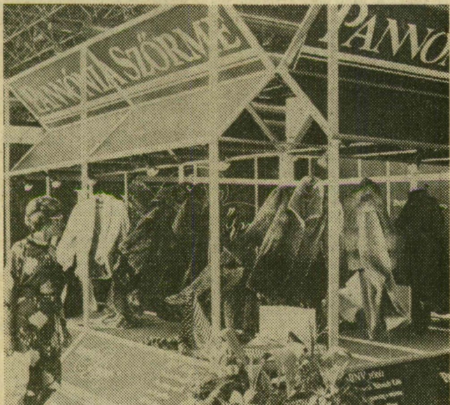
Bunda minden mennyiségben, s minőségben, hiszen a nagydíj is ezt bizonyítja