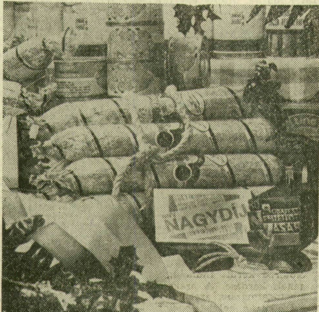
A nagydíjas Pick szalámi hirdeti, hogy a szegedi hentesek igazán tudják, mi a csemege

A szovjet külkereskedelmi egyesületek közül ez-úttal a Technointorg hívta szakmai találkozóra magyar úrteljeit, köztük a Konsumex, az Elektroimpex, az Elektromodul és a Ferunion, valamint a belkereskedelmi vállalatok képviselőit. Elmondták, hogy idei kiállításukat a kapcsolatok további bővítésének reményében rendezték meg, s eddigi vásári tárgyalásaik jók.