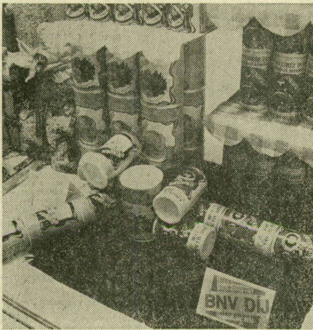
A Csongrád megyei Gabonaforgalmi és Malomipari Vállalat Unikron termékei szép elismerést kaptak