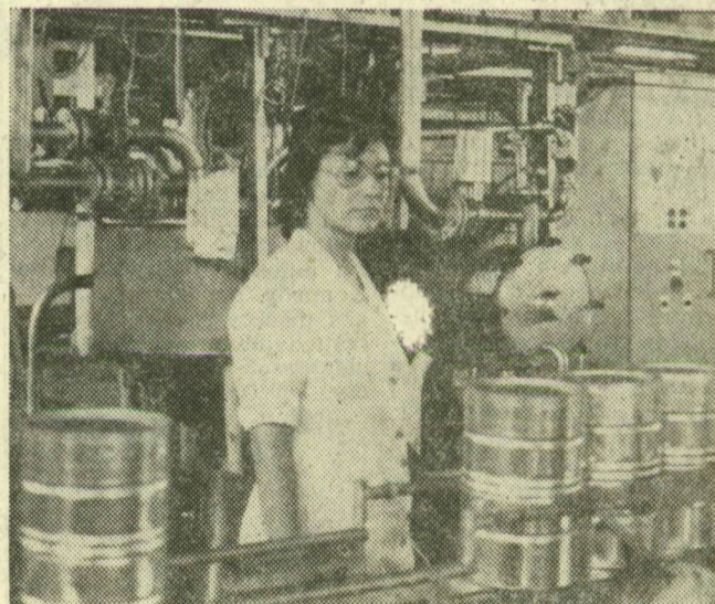
Fémdobozokba töltik a paradicsompürét

A Szegedi Konzervgyárban paradicsomot és őszibarackot dolgoznak föl ezekben a napokban — már amennyit a fagy, a hideg és a jégverés meghagyott. A mennyiség tehát kevesebb a vártnál, a minőség azonban jó, s ami a fő, a legfontosabb rendelkezéseket ki tudják elégíteni. Naponta átlag 4—500 tonna paradicsomzsalék érkezik a gyárba, ahonnan sűrítésként indul útnak külföldre — tőkés piacra — és a hazai boltokba. A feldolgozott őszibarackot szocialista országokba és belföldi üzletekbe szállítják.