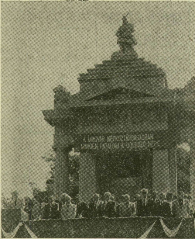
A nagygyűlés elnöksége az Árpád-emlékmű előtt

Az ünnepi beszéd után nemzeti színű szalaggal át-