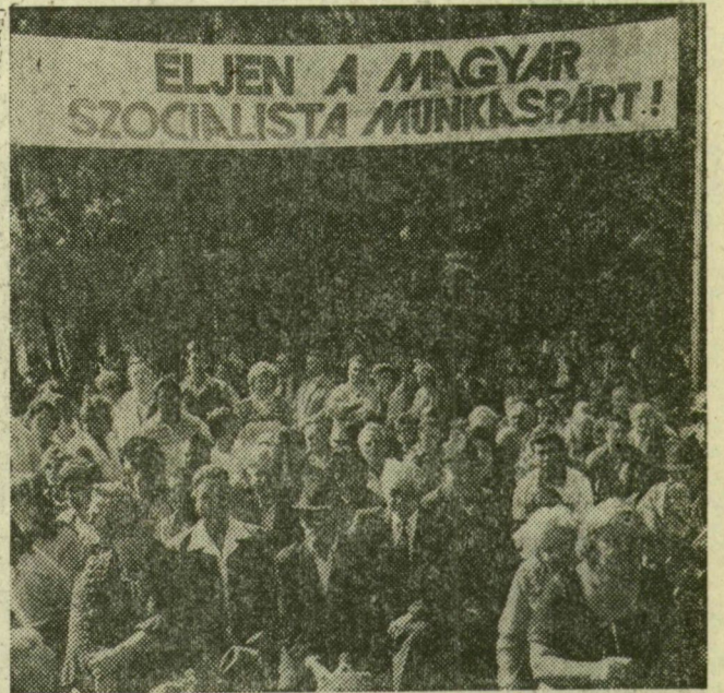
Az ünneplők egy csoportja

A késő esti órákig maradt a közönség. Kellemes időben, csodálatos környezetben főztek, ettek, ittak, pihentek, s költhették pénzüket a vásároozók portékáira. A kikapcsolódás egy napig tartott. Következnek a dolgos hétköznapiak, hogy jövőre is mosolyoghasson a kenyér.