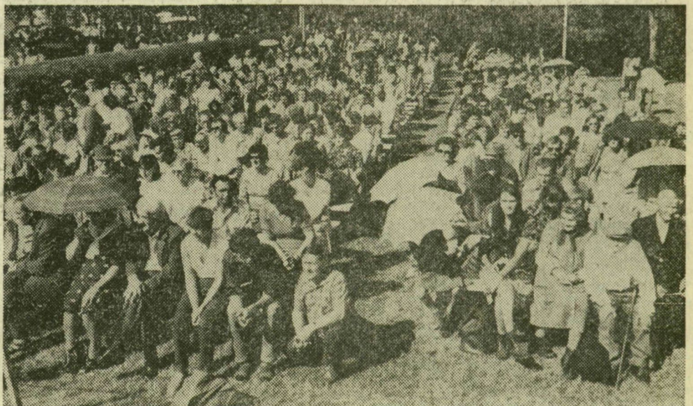
Szerencsére, napsütés ellen kellett az ernyők