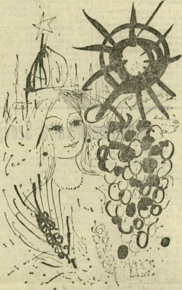
KONDOR LAJOS GRAFIKÁJA

Olyan alkotmánymódosítást fogadott el 1972-ben az országgyűlés, amelyik sok tekintetben újformálta alap-törvényünket, majd ezt követően létrejöttek olyan államjogi jelentőségű törvények, mint például a bíróságról és az ügyészségről