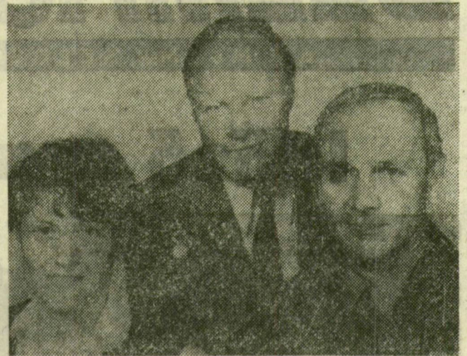
A Szojuz T-12 űrhajósai (jobbról balra): Vlagyimir Dzsanibekov parancsnok, Igor Volk kutatómérnök és Sztvetlana Szavickaja fedélzeti mérnök.