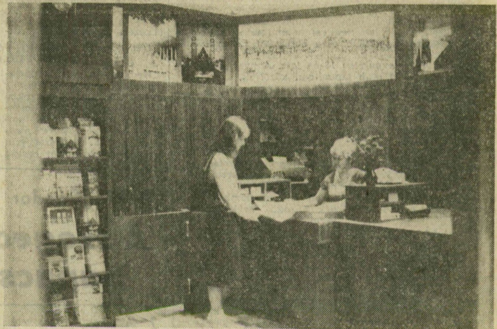
A szeged Tourist Klauzál téri új irodája

Elébe vágott az Országos Idegenforgalmi Tanács nem túl régi keltezésű határozatának a Szeged Tourist — jó értelemben persze. Ugyanis már akkor tervezték, hogy a Klauzál téren megüresedett helyiségüket informá-