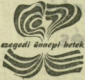
szegedi ünnepi hetek

Pedagógiai Nyári Egyetem Újszegeden, az MTA Biológiai Központban, július 17-től 24-ig. Megnyitja: kedden délután 10 órakor. Muzsikáló udvar a városi tanácskúrtán: a Collegium Musicum együttes hangversenye július 17-én, kedden este fél 9-től. Szörényi Levente-Bródy János: István, a király. Nyilvános főpróba a Szegedi Szabadtéri Játékokon, július 19-én, este fél 9-től, a Dóm téren. Kovács Tamás Vilmos festőművész alkotásai a Bartók Béla Művelődési Központ B galériájában, szeptember 2-ig. Nyitva: 10-18 óráig. Pataki Ferenc alkotásai az Ifjúsági Házban július 30-ig. Nyitva: 10-18 óráig.