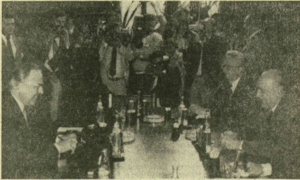
Kádár János a Parlamentben megbeszélést folytat Helmut Kohl nyugatnémet kancellárral.

Kádár János és Losonczi Pál fogadta Helmut Kohlt Nemzetközi sajtókonferencia — Látogatás Debrecenben