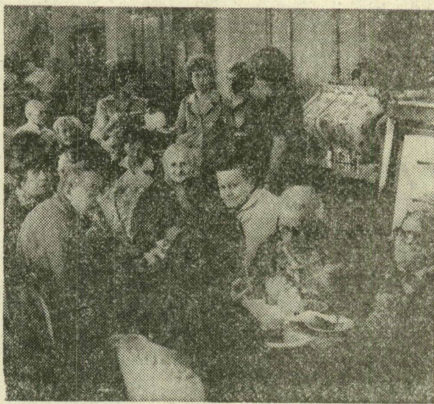
Időseket látott vendégül Szegeden a Virág cukrászdában a HungarHotels Vállalat Vörös Zászló szocialista brigádjia. A petőfitelepi szociális otthon gondozottait is patronáló brigád tagjai, pénteken délután csokitortával, piskótával, tejszínes kávéval és üdítővel várta az Acél utcai otthon 20 lakóját. Jó hangulatban töltötték néhány órát a deres hajú vendégek, akikkel üzenik a brigádtagok, hogy társaikat tíz nap múlva ugyanitt szívesen fogadják.