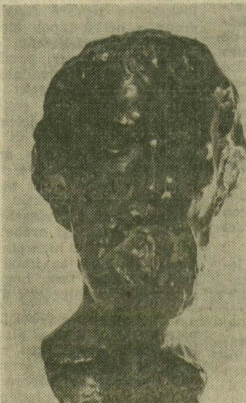
KÁROLYI LAJOS PORTRÉJA

Petri Lajos 1909 őszétől több mint tíz éven át Brüsszelben tartózkodott. Szobrászata a belga plasztika értékes tanulságai alapján egyre erettebbé vált. A külföldi tárlatokon díjakat nyert