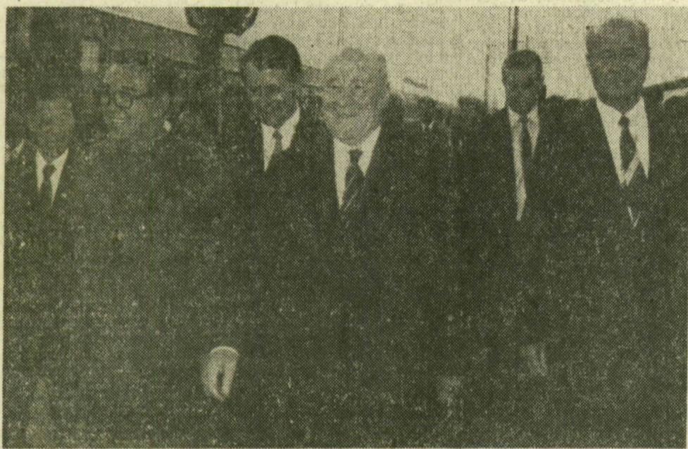
Kim Ir Szen Kádár Jánossal és Losonczy Pállal a Keleti pályaudvaron.

A Magyar Szocialista Munkáspárt Központi Bizottságának, a Magyar Népköztársaság Elnöki Tanácsának és Minisztertanácsának meghívására párt- és állami küldöttség élén esztendőnkön hivatalos, baráti látogatásra hazánkba érkezett Kim Ir Szen, a Koreai Munkapárt Központi Bizottságának főtitkára, a Koreai Népi Demokratikus Köztársaság elnöke.