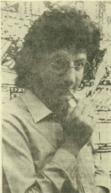
Esterházy Péter író a Móra könyvesbolt vendége volt

Mindjárt vakáció, olvashatnak a gyerekek. Tán az sem árt, ha kölcsönadják a könyvet nekünk, szülőeknek. Ismerkedjünk a csemetéinkkel!