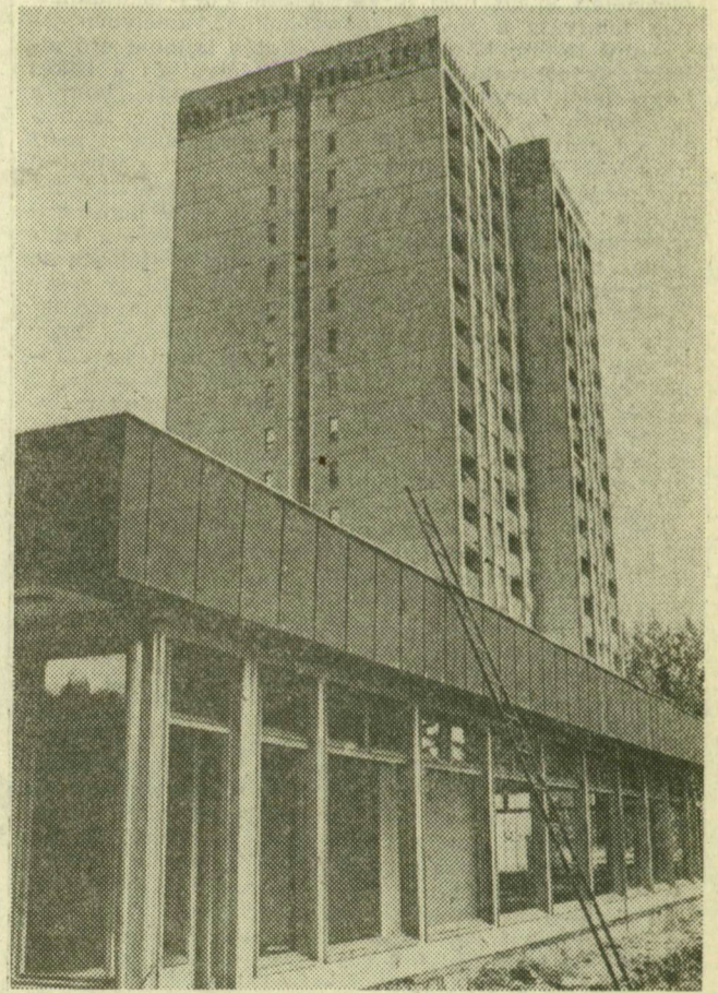
A toronyház tövében rekordgyorsasággal épül az áfész 700 négyzetméteres ABC-áruháza, ahol az élelmiszeren kívül apróbb iparcikkek is találhatók majd az újszegediek