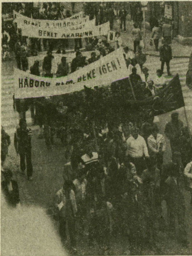
A fiatalok békemenete a Kárász utcán vonult a Vörös Csillag mozihoz.

Pár hónappal ezelőtt szegediek ezrei a város központjában, a Kárász utcán, aláírásukkal bizonyították: a város lakói most, a feszült világpolitikai helyzetben is egyet szeretnének: békét Európának, békét az egész világnak. Akkor az egyetemista fiatalok rendeztek békenapot a megyeszékhelyen. Tegnap, a győzelem napja alkalmából a szegedi városi KISZ-bizottság felhívására Szeged nagyzüzeleinek munkásfiataljai gyülekeztek a Dugonics téren, hogy részt vegyenek a békemenetben, amely a Kárász utcán, a Széchenyi téren át vonult a nagygyűlés színhelyére, a Vörös Csillag moziba.