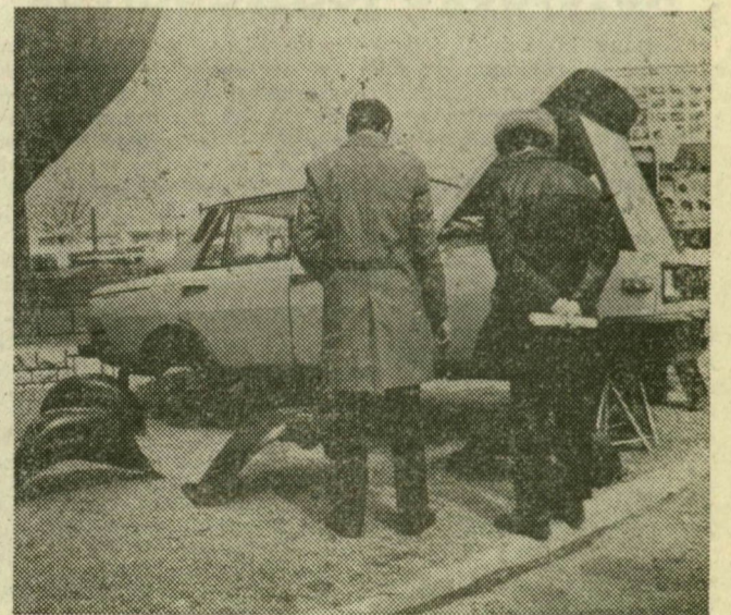
A korrózió elleni védekezésnek ez egy új módja