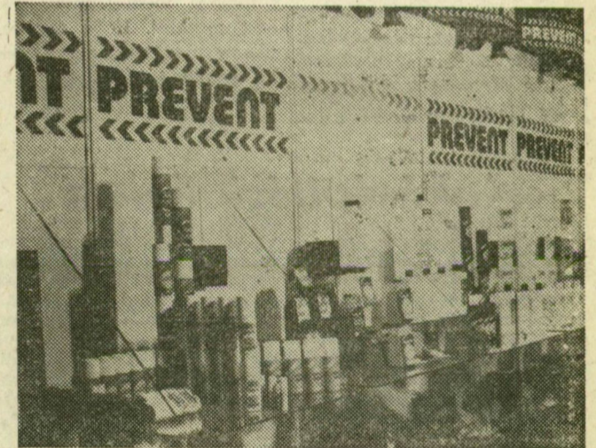
E szerek a bajok megelőzését szolgálják