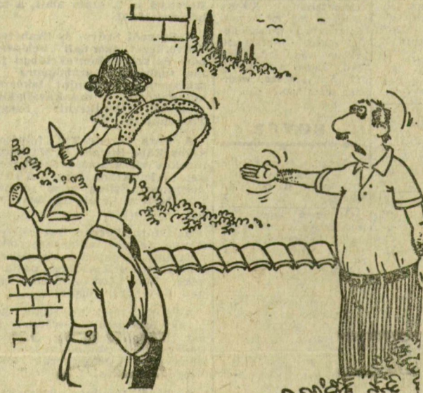
— Ezen a kiskertisoron itt van a legszebb kilátás

A Sportfogadási és Lottó Igazgatóság közlése szerint a farsangi lottószelvények nyerevénye az illeték levonása után a következő: öt találatot egy fogadó ért el, a nyerevénye 1 332 697 forint. Négytalalatos szelvény 75 darab van, nyerevényük egyenként 71 077 forint. Háromtalalatos szelvény 5473 darab, nyerevényük egyenként 609 forint. Kéttalalatos szelvény 169 756 darab, nyerevényük egyenként 25 forint.