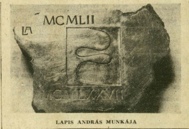
LAPIS ANDRÁS MUNKÁJA

(A Narodne novine című szerb-horvát hetilapból fordította: Berkes Ákos.)