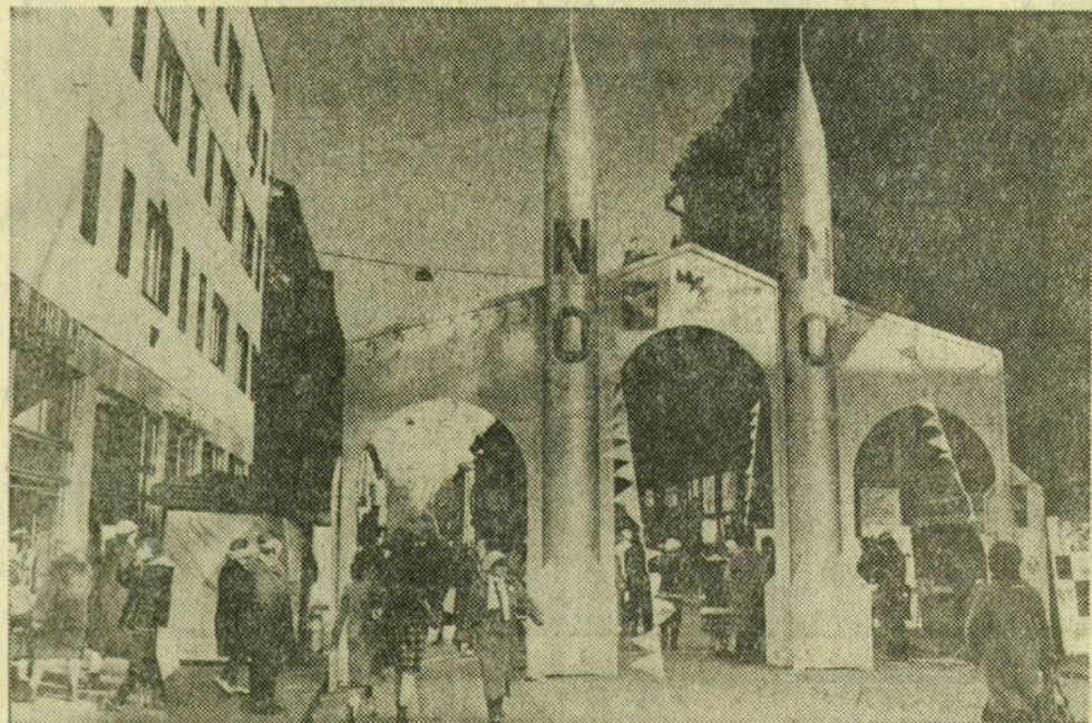
Békekapu a Kársz utcán

Eddig távoli szemléltető voltunk az eseményeknek. Néztük a tévében, hallgattuk a rádióban, olvastuk az újságokban, hogy rajtunk kívülálló erők dönthetnek a mi sorsunkról. Mégis messze volt, távoli, abszurd ötletnek, morbid játéknak tűnt, amiről csak az igazán bennfentesek tudták, véresen komoly. Most már mi is tudjuk és érezzük igazi veszélyét, itt, Közép-Kelet-Európában is egy „Pershing-tűzijáték színpadának” kelős közepén.