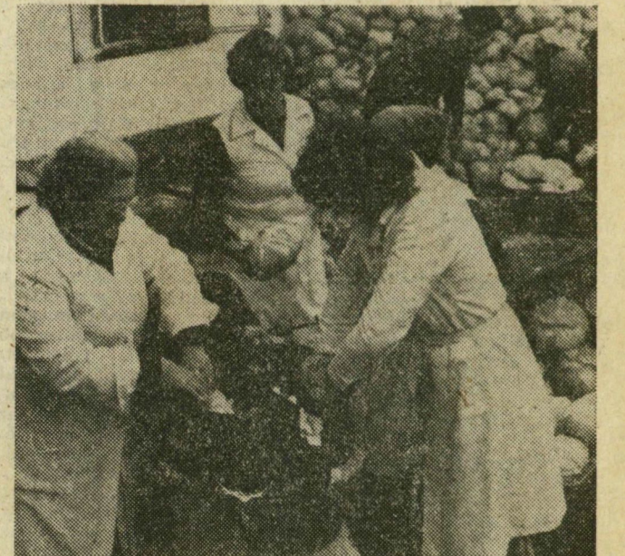
A savanyítóüzem udvarán géppel szelik a káposztát.

lyozó és Kavicskotró Vállalat egyik nagy teljesítményű kotróhajója több mint 20 000 köbméter iszaplerakódást távolított el a kikötő kapujában a mederből. Ezzel olyan mélységű utat készítettek, amelyen keresztül akadálytalanul bevonulhatnak a védett öblözetbe a hajók. A téli időszakot felhasználják arra, hogy felújítsák, megszépítsék az arra rászoruló fürdő- és csónakházakat.