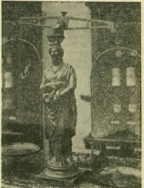
Jusztícia a patikabemutatón