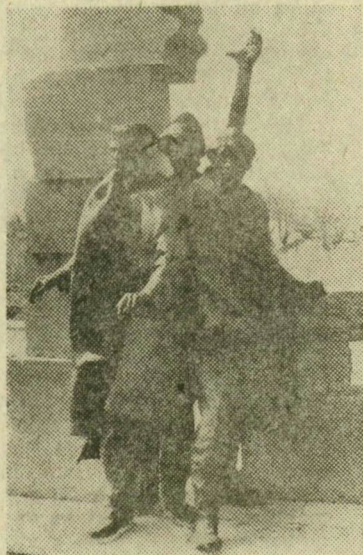
A rúzsai felszabadulási emlékmű