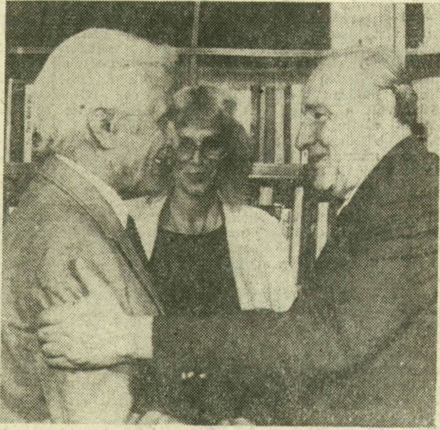
Kádár János fogadja Alvaro Cunhalt

A találkozón részt vett Horn Gyula, a KB külügyi osztályának vezetője. (MTI)