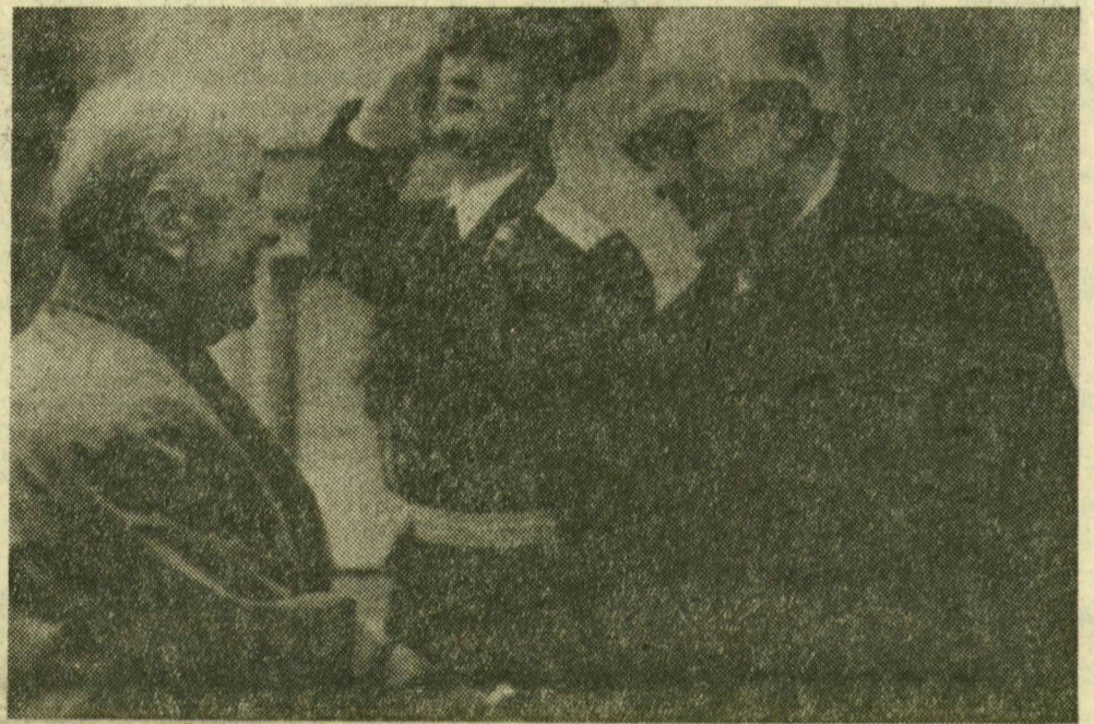
Jurij Andropov búcsúzik Kádár Jánostól

Koszorúzás — Kádár János és V. Scserbickij találkozója — Lázár György beszéde Díszvacsora, pohárköszöntők