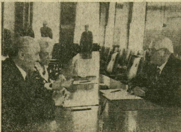
Kádár János és Jurij Andropov tanácskozik