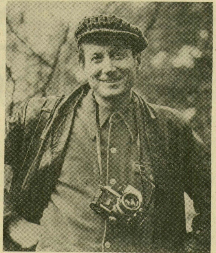
Jevgenij Jevtusenko július 18-án ötvenéves