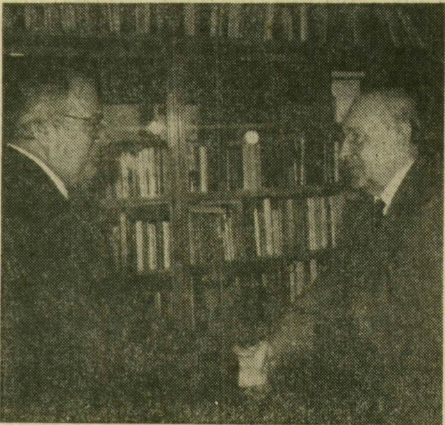
Kádár János és Pierre Mauroy találkozója a Központi Bizottság székházában

Trautmann Rezső, az Elnöki Tanács helyettes elnöke kedden délelőtt az Országsházában fogadta a hazánkban hivatalos látogatáson tartózkodó Pierre Mauroy-t, a Francia Köztársaság miniszterelnökét. Szíves légkörben beszélgetést folytattak a francia kormányfő mostani, első magyarországi látogatásának jelentőségéről, annak eredményeiről és a két ország közötti kapcsolatok továbbfejlesztésének fontosságáról.